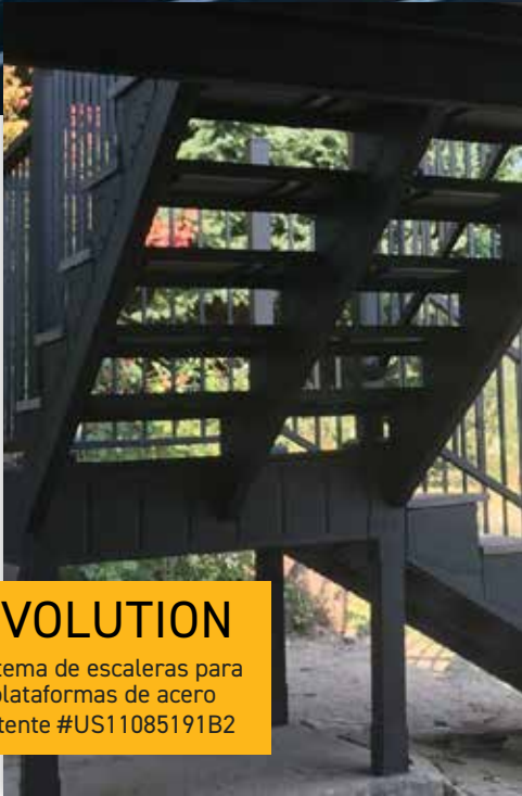
EVOLUTION Sistema de escaleras para plataformas de acero Patente #US11085191B2